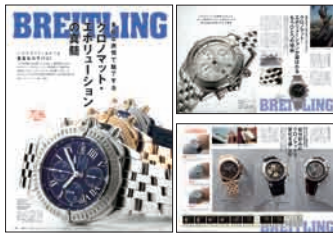
08年2月 / Vol.29 BREITLING February, 2008 / Vol. 29 BREITLING