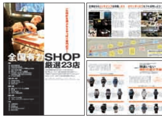
07年8月 / Vol.27 正規店連合企画 August, 2007 / Vol. 27