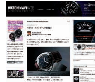
※写真はトップ画面です。 ※the picture is an opening image.