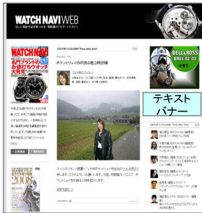
■WATCH NAVI WEBトップページ