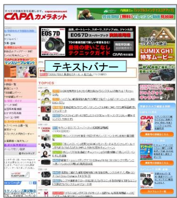
■CAPAカメラネットトップページ