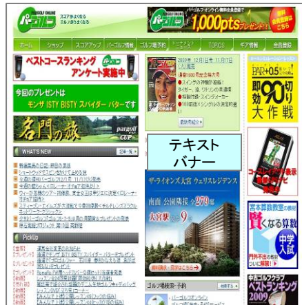
■パーゴルフ・オンライントップページ