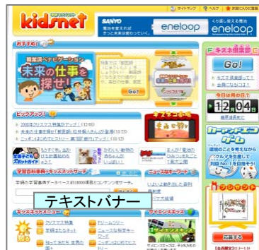
■学研キッズネットトップページ