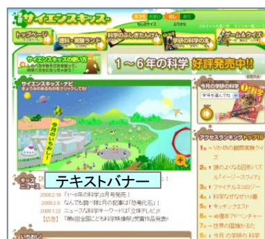
■サイエンスキッズトップページ