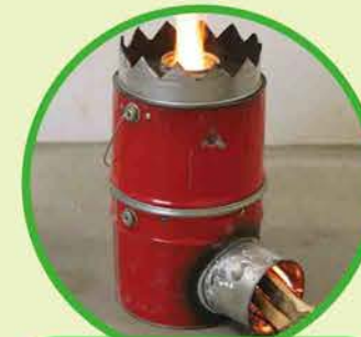
ロケットストーブ